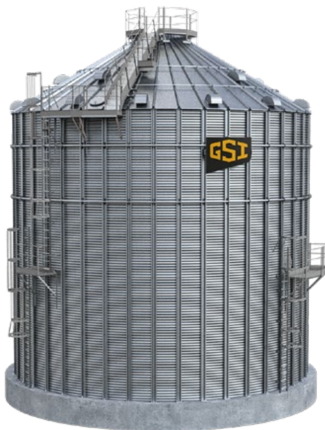
Silo armazenador fundo plano