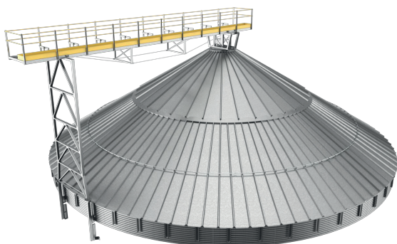
Vista geral da PAS-150 instalada

Passarela metálica leve, com ótima relação peso/comprimento, que garante condições para que os transportadores possam trabalhar de forma adequada na movimentação horizontal de grãos. É utilizada em aplicações com vãos de até 11m e fluxos de até 120t/h.