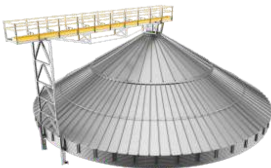
Vista geral da PAS-150 instalada

Passarela metálica leve, com ótima relação peso/comprimento, que garante condições para que os transportadores possam trabalhar de forma adequada na movimentação horizontal de grãos. É utilizada em aplicações com vãos de até 11m e fluxos de até 120t/h.